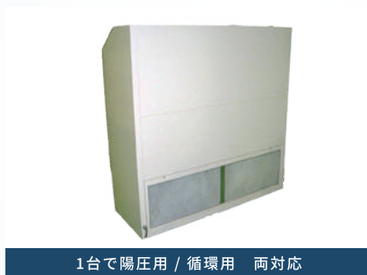
1台で陽圧用 / 循環用 両対応