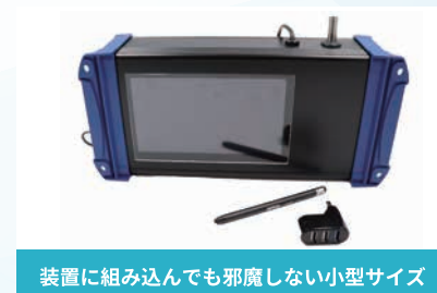
装置に組み込んでも邪魔しない小型サイズ