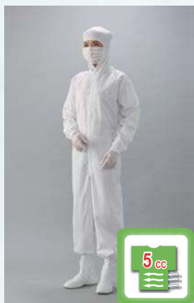
フード一体つなぎ服 型式：CJ1332

《各工程で不良となる粒子の大きさ》=(イコール)《クリーンウエア内から流出してはいけない塵埃》とみなし、シーズシーでは代表的な下記ウエアの生地 (CJ・CR・CK) を用いて実験を行い、微粒子 (0.3~10μm)・粗大粒子 (10~100μm) それぞれの不良となる粒形に対応したクリーンルームウエアを推奨します。実験結果からシーズシーでは、作業効率が向上する涼しいウエアをご案内します。