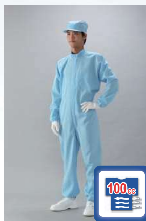
フード別つなぎ服 型式：CK1040