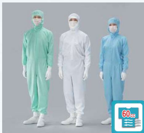
フード別つなぎ服 型式：CR1038