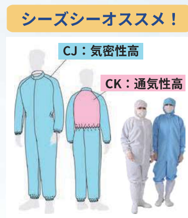
フード別つなぎ服 型式：CP1050