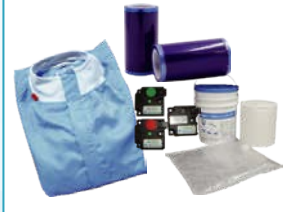
消耗材各種 ウェア / 粘着アイテム / ワイパー 清掃用品 / 静電気対策グッズ...