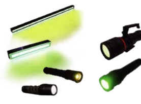
クリーンルームライト 各種