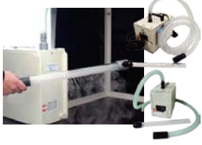
気流可視化装置 ミストストリーム