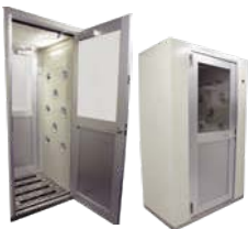
EVE (イヴ) エアシャワー CAS-101PSL-EJEVB