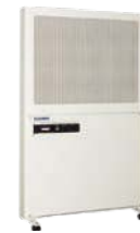
クリーンウォール 給気 排気