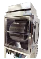
タンプリング装置